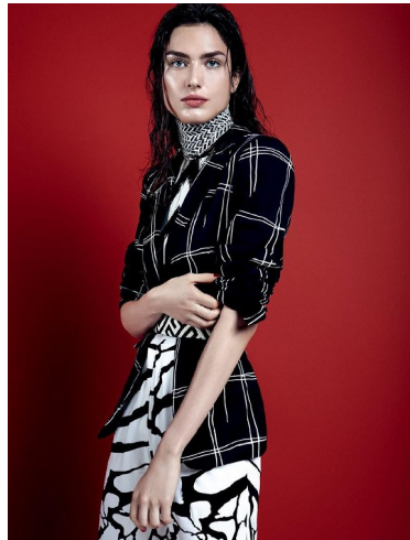
Blusa Adriano Paolone , R$ 1.000. Saia Adriano Paolone , R$ 1.000. Calça Adriano Paolone , R$ 1.000. Botas Miu Miu , preço não revelado.