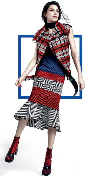
Calça Calvin Klein , R$ 200. Vestido Calvin Klein , R$ 2.254. Blusa em A Brand , R$ 199. Botas Miu Miu , preço não revelado.